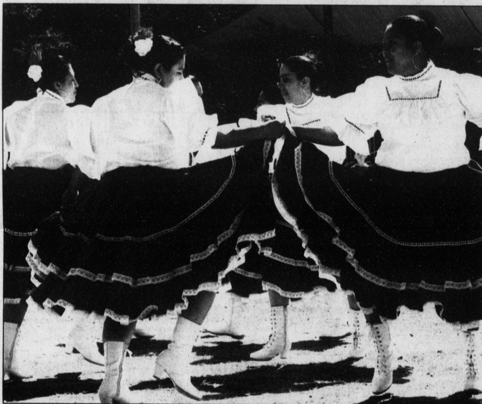
La Fiesta de la Familia, que entra en su cuarto año de existencia, ha tenido mucho éxito. El Centro está preparándose para otra Fiesta el 31 de agosto de 11 a.m. a 6 p.m. Vea página nueve para más información sobre las celebraciones.